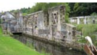
Vestiges des papeteries Vallée.

En 1886, les rives de la vallée du Léguer comptent plus de 150 moulins utilisés pour moudre le grain, pour le tannage, le teillage du lin et la fabrication du papier.