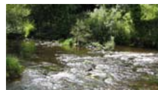
Les rives du Léguer (Pays touristique Terres d'Armor)

10 Reprenez le circuit sur la route et plus loin tournez à droite de la fourche, pour rejoindre la chapelle Locmaria.